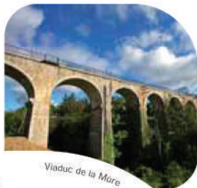
Viaduc de la Mûre